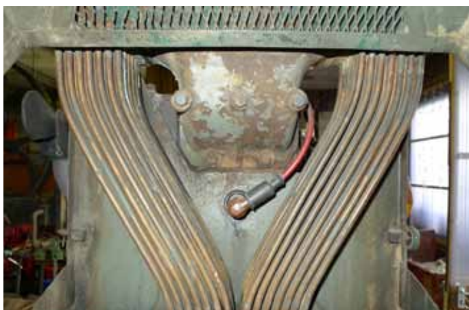
Le système de refroidissement par liquide du moteur Bernard pour la scie avec ses tuyaux en cuivre