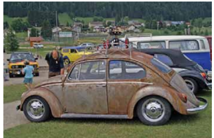
Coccinelle de couleur rouille mais non perforée