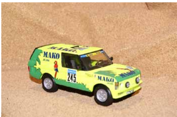
1988 Range Rover Mako

Ces miniatures sont réalisées en résine et vous pouvez retrouver tous les modèles sur le site