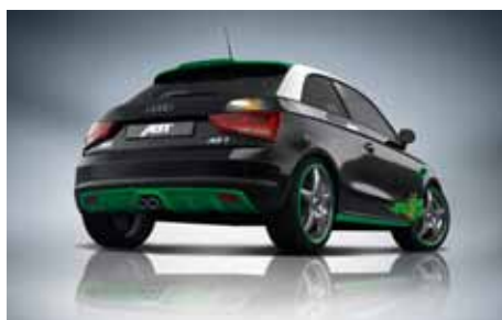
ABT Sportsline présente sa version de l'Audi A1, la AS 1