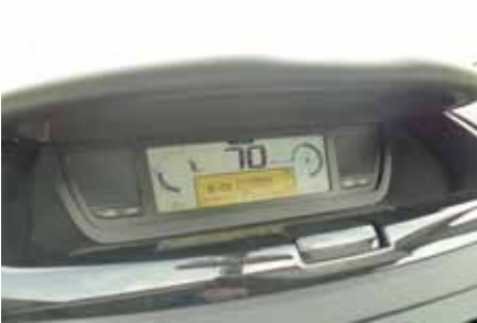
Affichage décentralisé et digital pour le Citroën C4 Grand Picasso