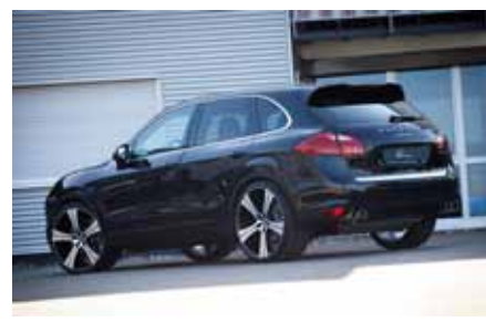
Lumma Design habille la dernière Porsche Cayenne