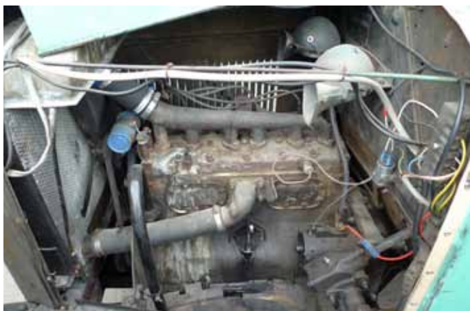
Le moteur 6 cylindres de 2'500 cm3 équipait les modèles Essex et Hudson