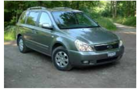
Pas de changement pour la ligne très orientée US