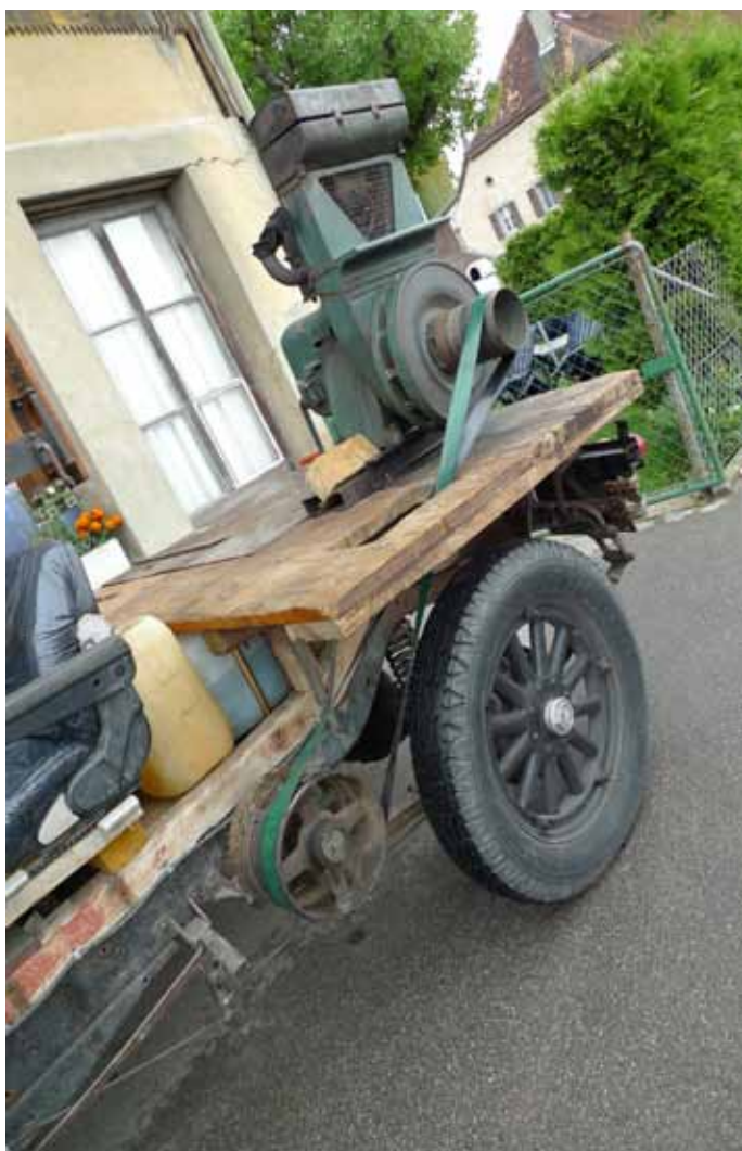
Le moteur Bernard, la courroie croisée et les deux poulies, la seconde entraîne la scie à ruban