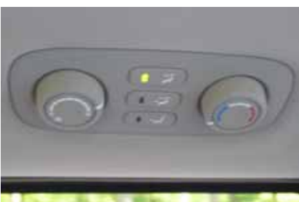
Climatisation à réglage séparée pour les passagers arrière