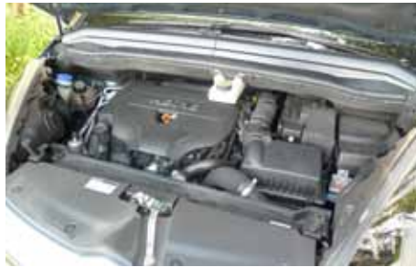
2.0 I HDI de 140 chevaux mais agréable dans ses reprises