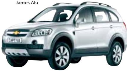
Captiva 2400 LS 2WD Cool dès CHF 27'990.- (5 portes, 2405 ccm, 100 kW/136 ch) Photo: Captiva 2000 VCDi LT Exec. 4WD Cool, CHF 43'290.- (1991 ccm, 110 kW/150 ch)