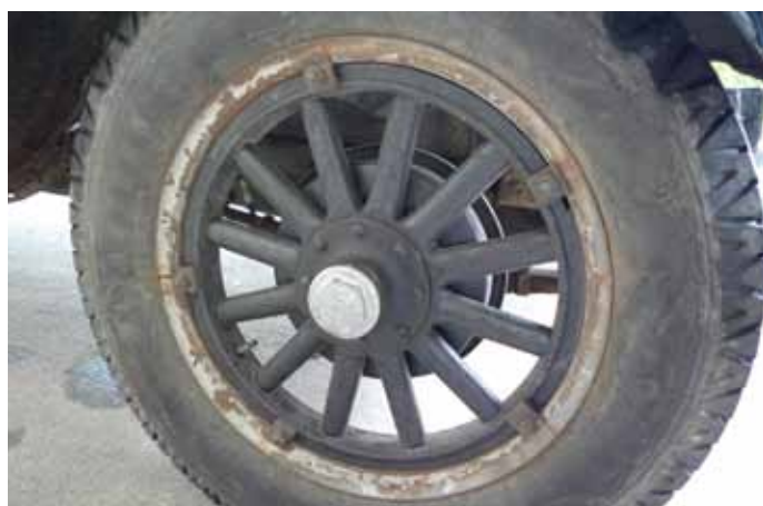
Les roues à rayons en bois. La jante et le pneu sont fixés par des boulons