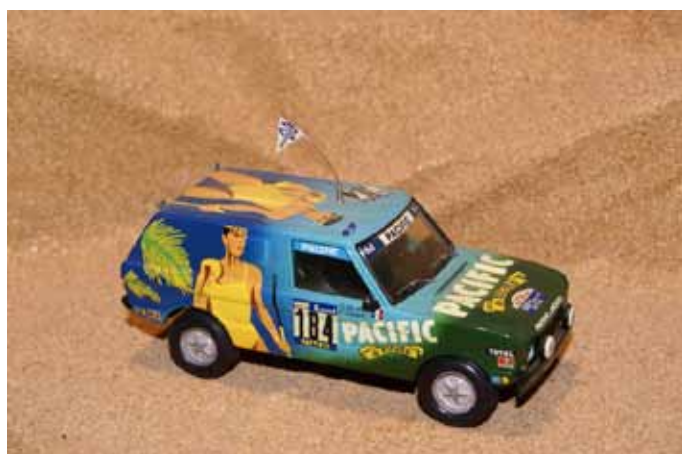
1984 Range Rover Pacific