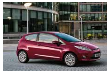
Une Fiesta pour la plus belle place de grillades