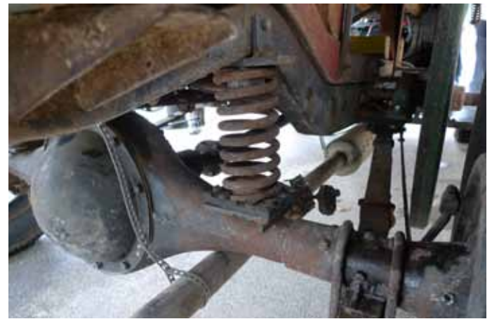
Les dessous de Grand Mère La Scie, pont arrière, ressorts et lames