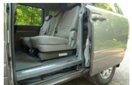
Option portes arrière et hayon électriques sur le Kia Carnival