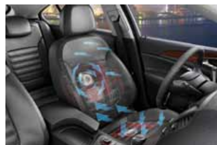
nouveau siège climatisé pour les Opel Insignia

Les spécialistes suisses du BBQ sont tout feu tout flamme : ils ont déjà soumis près de 300 propositions. Celui ou celle qui dénichera la plus belle place de grillades remportera une Ford Fiesta flamboyante neuve.