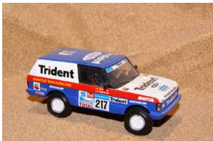
1991 Range Rover Trident