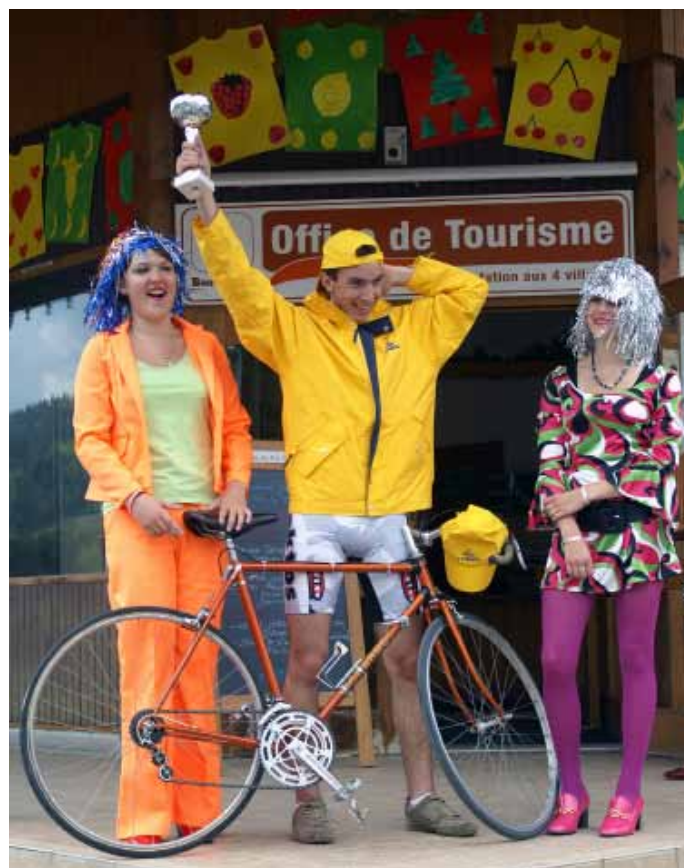
Le grand vainqueur de l'étape Bois d'Amont - Bois d'Amont lors du Tour 1960 entouré des ravissantes hôtesse de l'épreuve