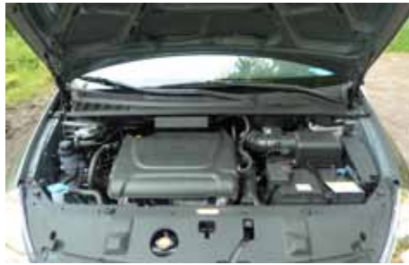
Un Diesel de 2.7 L de 178 chevaux, un vrai régal