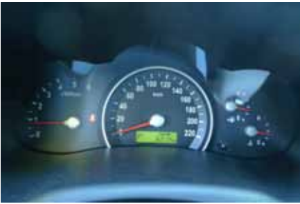
Gros compteur rond très classique pour le Kia Carnival