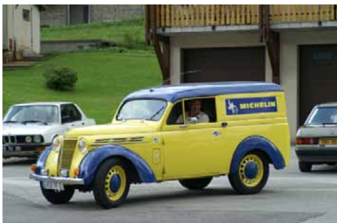
Parmi Les véhicules du Tour de France 1960, une Juva 4 aux couleurs de Michelin