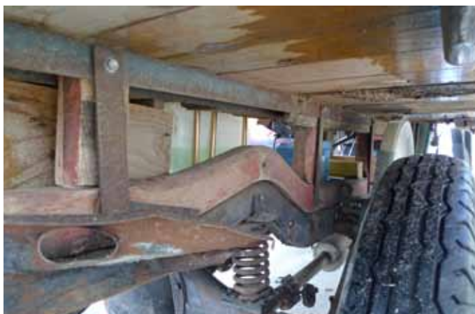
Double châssis fer et bois. Le support du plateau est un ajout pour supporter le moteur et la scie