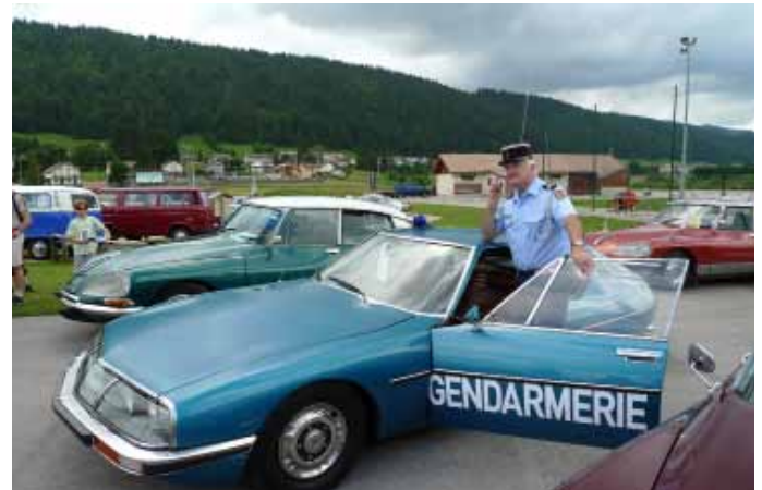
Allo, Zebra 3, la Gendarmerie veille au grain, le Colonel a l'oeil et le bon pour débusquer les chauffards !