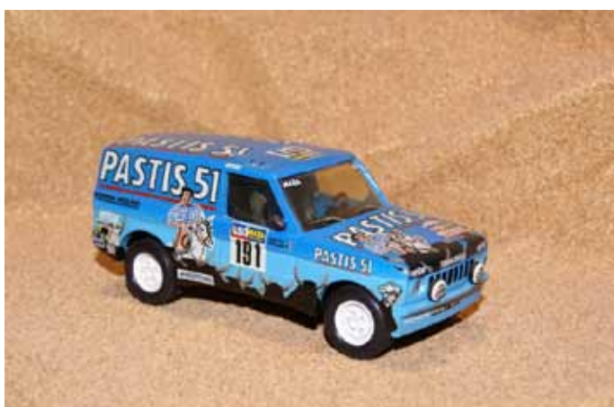
1986 Range Rover Pastis 51