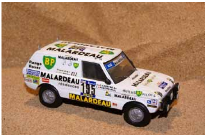
1984 Range Rover Malardeau