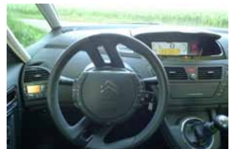
Une bonne idée, la jante du volant tourne mais pas les commandes