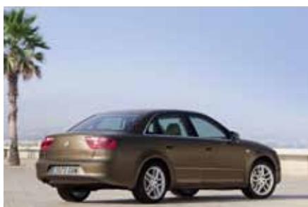
Moteur 1.8 L de 120 chevaux en 2011 avec boîte automatique