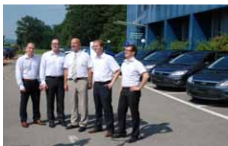
Six Ford Focus pour les chefs des patrouilleurs du TCS

Les utilisateurs de ces pays seront les premiers Européens à pouvoir bénéficier de la mobilité zéro émission conçue par Nissan. Au Portugal et en Irlande les premières livraisons de la LEAF auront lieu en février 2011 tandis que la Grande-Bretagne disposera de ce modèle dès mars 2011.