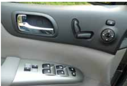
La portière conducteur du Kia regroupe toutes les commandes