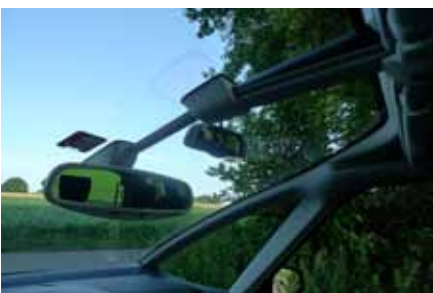
Pare-brise TGV pour le C4 et double rétroviseurs