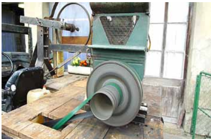
Le moteur est installé sur un plateau en bois. On voit la courroie croisée qui entraîne la scie à ruban