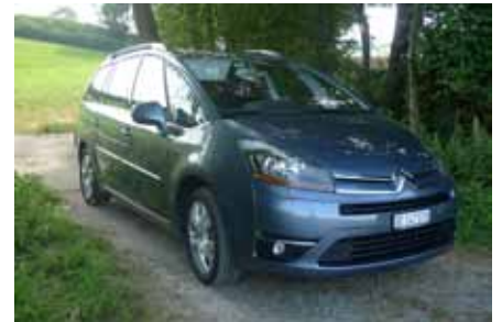
La ligne du C4 Grand Picasso est plus fine que son concurrent