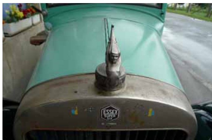
Essex Super 6 de 1927 équipée d'un moteur 6 cylindres de 2'500 cm 3

Ernest Pahud est mécanicien sur vélos et vélomoteurs - Il distribue la marque suisse TDS Tour de Suisse créée en 1934 - et réalise des travaux de menuiserie et de charpente. Il cherche un véhicule pour lui. Et tombe sur "Grand-Mère La Scie" ainsi surnommée depuis.