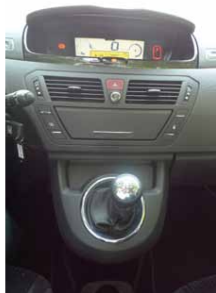
Le style et le traitement de la console diffère entre les deux