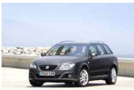
Nouveaux moteurs pour la Seat Exeo ST 1.8 et 2.0 TSI