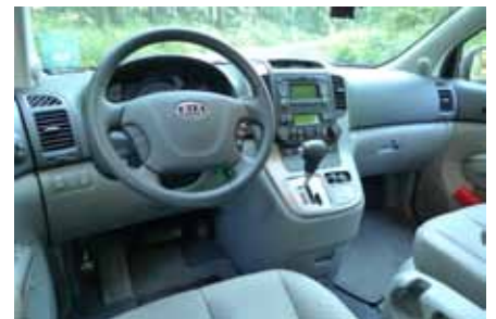
commandes au volant, boîte automatique et multi-rangements