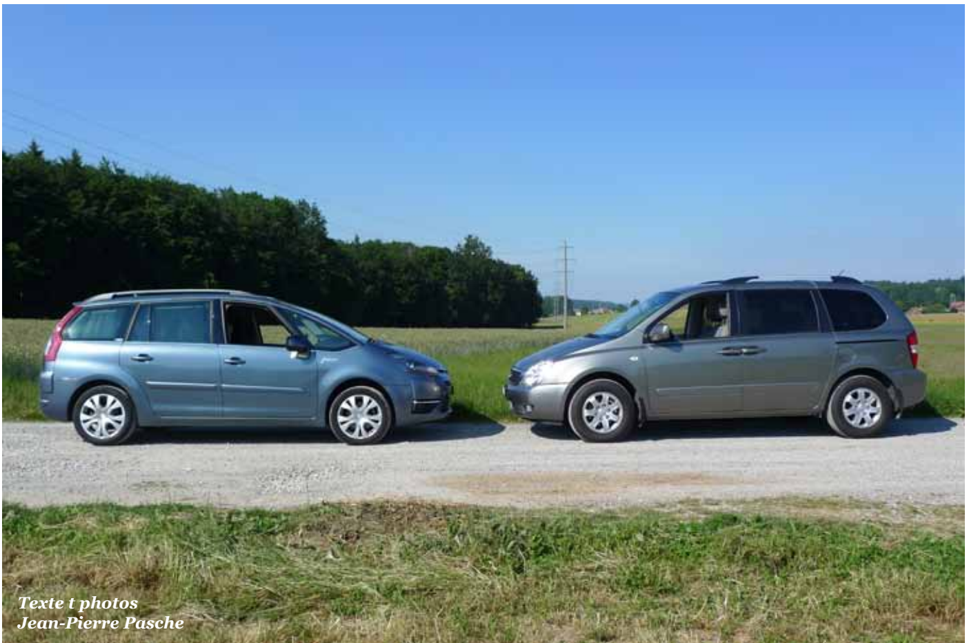
Texte et photos Jean-Pierre Pasche

Ils ne jouent pas dans la même cour. Mais proposent tous les deux d'emmener 7 personnes à leur bord. Si le Kia Carnival possède 7 vrais sièges, le Citroën C4 Grand Picasso additionne 5 + 2. En effet, les deux places supplémentaires sont moins accueillantes que dans le Carnival.