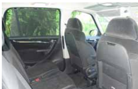
5 + 2, la 3ème rangée rentre dans le plancher sur le C4 Grand Picasso