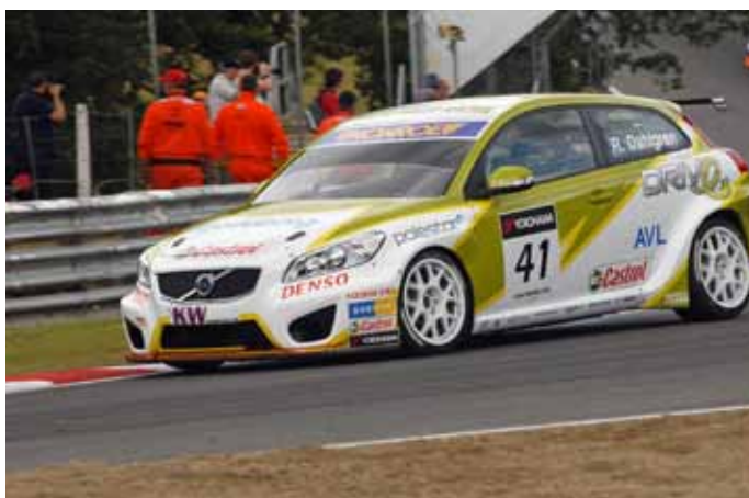
Nouvelle apparition de Volvo à Brands Hatch, tests pour la prochaine saison ?