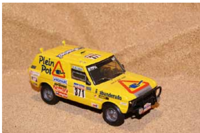
1985 Range Rover Plein Pot