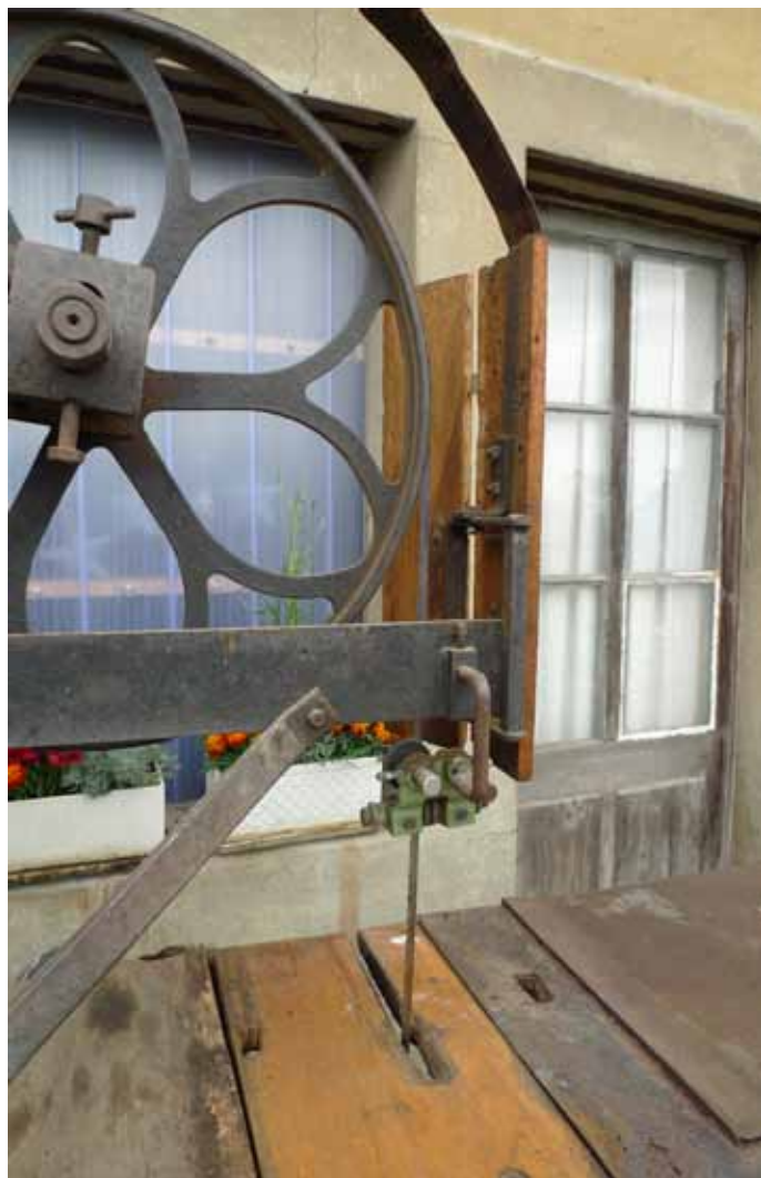
La lame de la scie à ruban se règle d'abord sur la roue puis ensuite par un levier et une vis sans fin