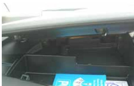
Deux Coffres sur le tableau de bord pour le C4 Grand Picasso