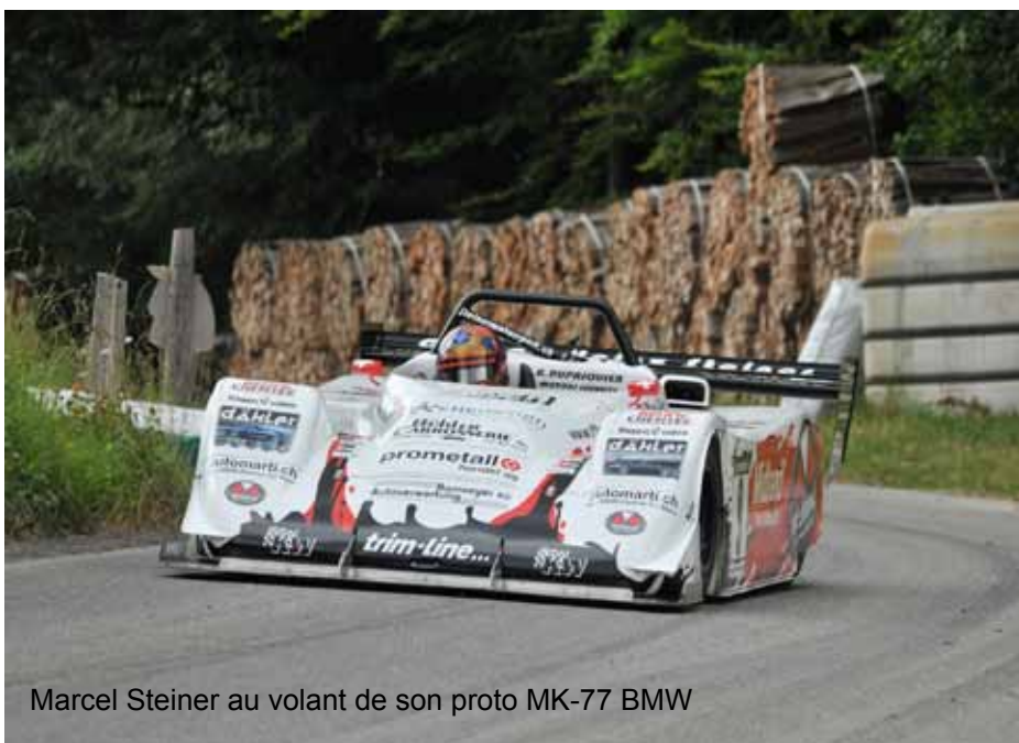
Marcel Steiner au volant de son proto MK-77 BMW

(Sous réserve de modification selon les informations du site de Auto Sport Suisse)