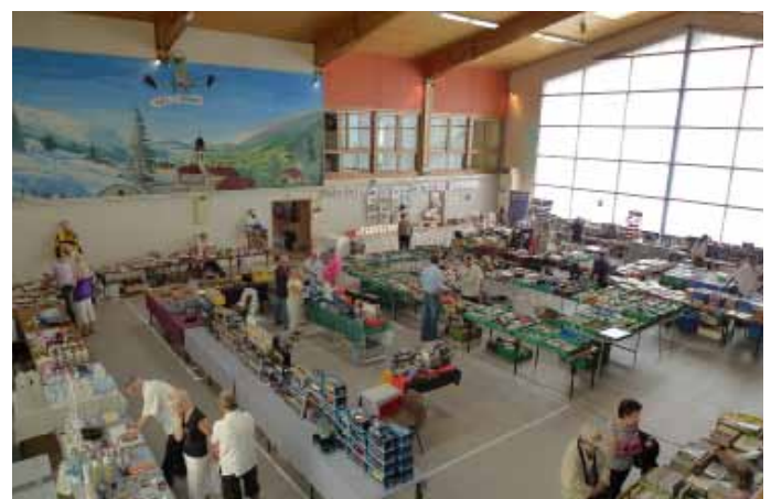
Un hall pour dénicher documentations, livres, pièces et miniatures