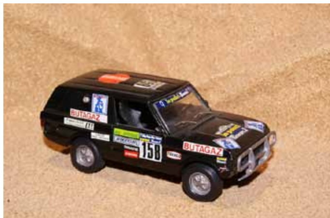
1983 Range Rover Butagaz