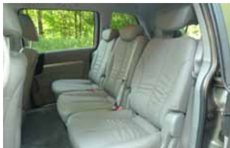
Le Carnival est un sept places. Les sièges sont lourds à manipuler