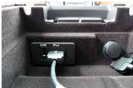
Les possesseurs d'iPod sont chouchoutés par Land Rover