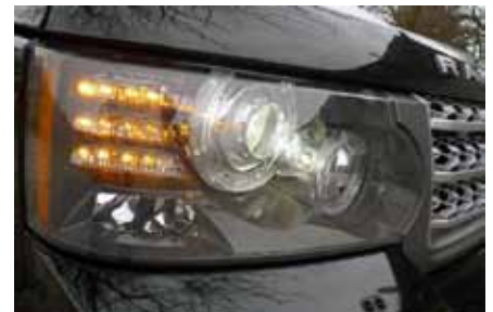
Optiques dernière génération avec LED. Y compris à l'arrière