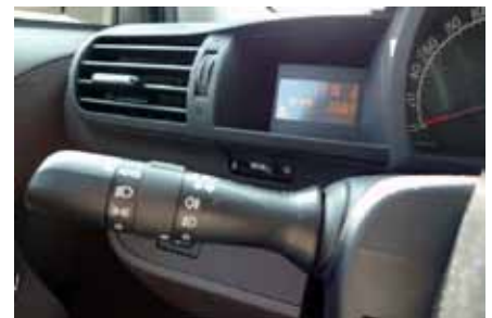
La remise à zéro du partiel est caché par le commodo des phares