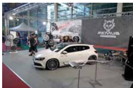
Parmi les Accessoiristes présents, Barracuda et ses Girlz Style