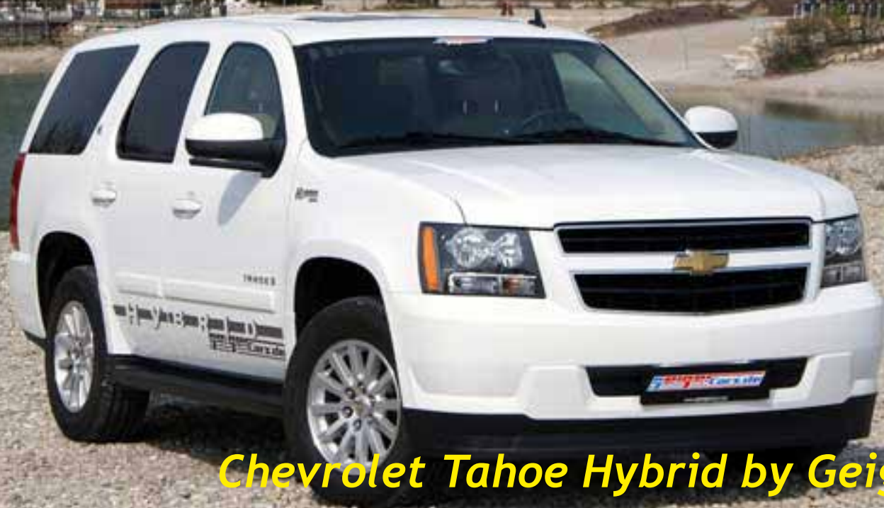
Chevrolet Tahoe Hybrid by Geiger

General Motors offre maintenant la synergie parfaite de l'espace, de la puissance des huit cylindres et de l'économie. Mais pourquoi se satisfaire de cela si nous pouvons être plus économiques et écologiques ? GeigerCars.de offre maintenant le Tahoe hybride même avec un système LPG.