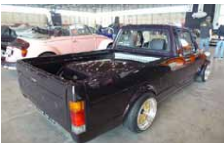
Caddy venu de Haute Savoie. Attention les gendarmes couchés