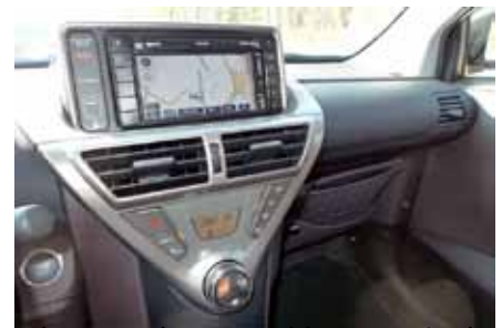
La console ressemble au poste de pilotage d'un vaisseau spatial