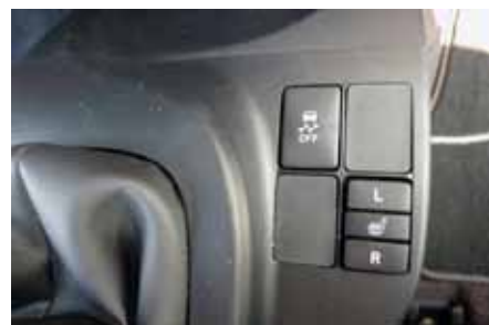
Sièges chauffants pour cette citadine marrante