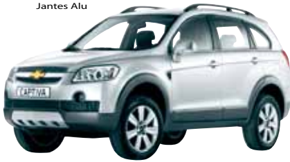
Captiva 2400 LS 2WD Cool dès CHF 27'990.- (5 portes, 2405 ccm, 100 kW/136 ch) Photo: Captiva 2000 VCDI LT Exec. 4WD Cool, CHF 43'290.- (1991 ccm, 110 kW/150 ch)