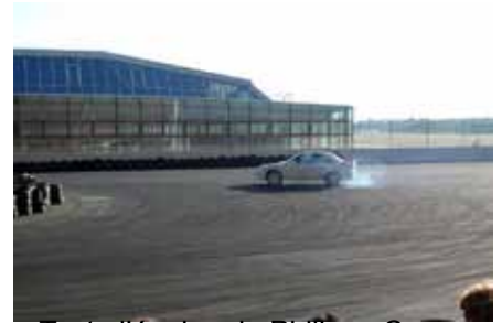
Toute l'équipe de Philippe Camandona pour les Drifts en 4x4