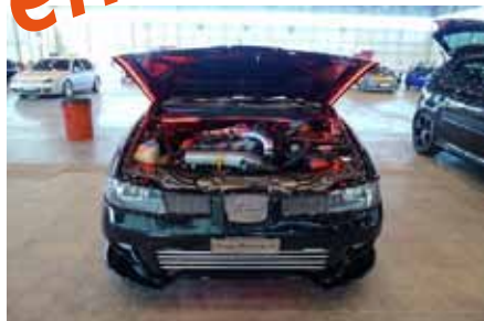
Seat Ibiza 1.8 20V Turbo Cupra 2 de Botty Tuning