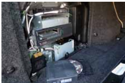
Le multimédia embarqué trouve son stockage dans le coffre arrière