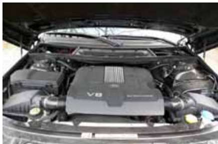
La grosse cavalerie toujours prêt à faire décoller le monstre