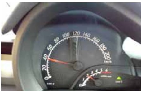
Shift en vert s'allume quand il faut passer la vitesse supérieure