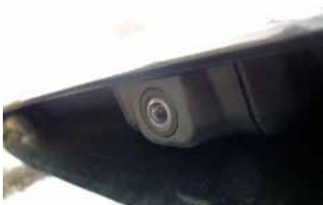
Caméras à 360°. Ici celle du coffre arrière