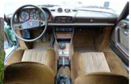
Les fauteuils sont confortables et la position est bonne mais basse