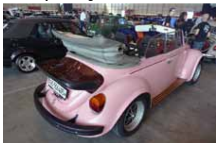
Cox de Barbie qui, pendant les photos, dessine assise au volant