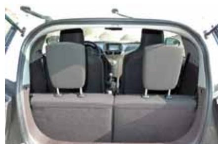
Les appuie-têtes arrière n'améliorent pas la visibilité