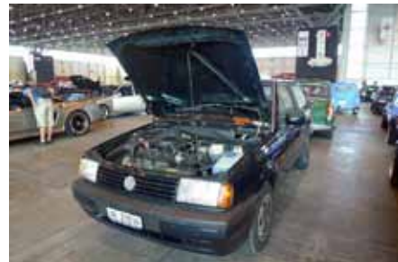
Capot ouvert comme les vraies, mais où est le Tuning ?