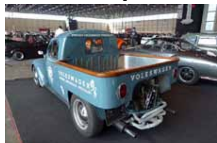
Réalisation GP, Garage Populaire à Crissier. Voir leur site Internet