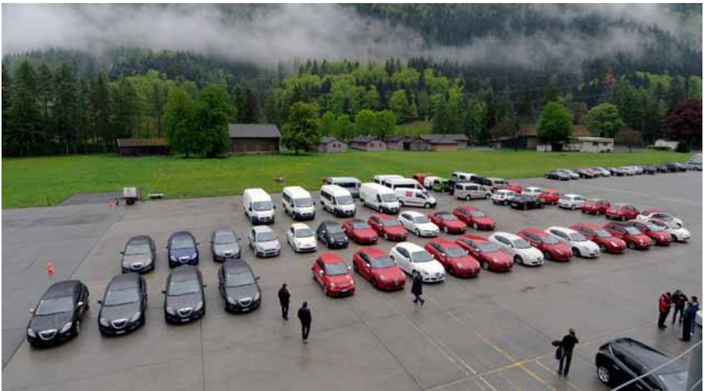
Présentation des différentes gammes du Groupe Fiat Suisse sur l'aérodrome d'Interlaken

Une première suisse pour le groupe Fiat. La présentation simultanée de tous les membres du Groupe Fiat Alfa-Roméo Abarth Lancia et Fiat Professionnel. Un univers en rouge dans un bunker du terrain d'aviation d'Interlaken.