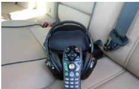
Casques infrarouges, télécommande, privilège des passagers