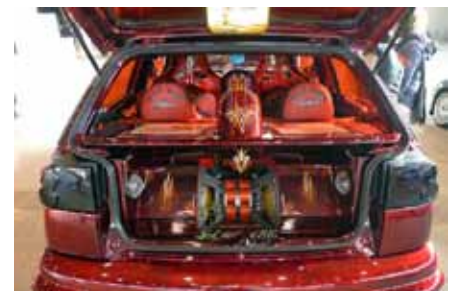
Golf VR 6, Ibiza El Diablo, le coup de coeur de la rédaction