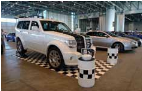
Bientôt Collector, un Dodge Nitro du Club Nitro de Genève