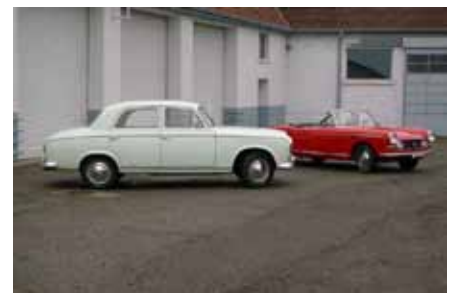
403 Berline et 404 cabriolet, le duel des générations