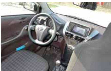
Le volant tombe bien en main. GPS en option sur notre modèle