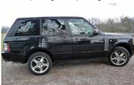
Sûr de lui et un peu hautain, le Supercharged est un aristocrate