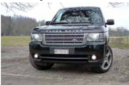
Quand on a son museau dans le rétro, on laisse passer la fusée