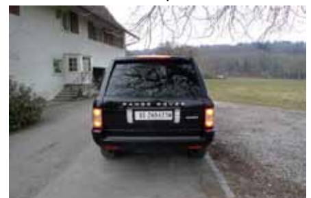
Eclairage LED pour une partie des feux arrière