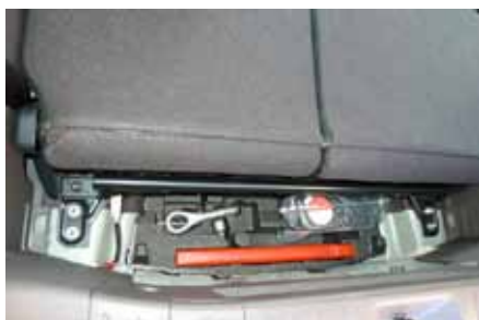
Sous le plancher, l'outillage de la demoiselle