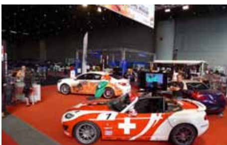
Pour ceux qui ne savent pas que Genève est en Suisse