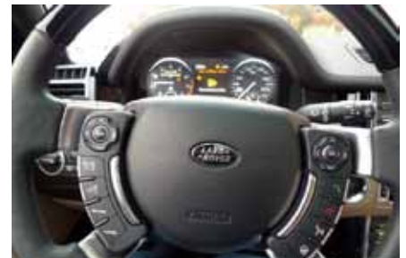
On peut vraiment parler d'un volant multi-fonctions, presque trop