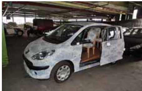
Effet Garanti avec carrosserie en tapisserie et plancher en parquet