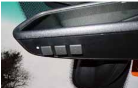
Commandes pour portail et garage intégrées dans le rétroviseur