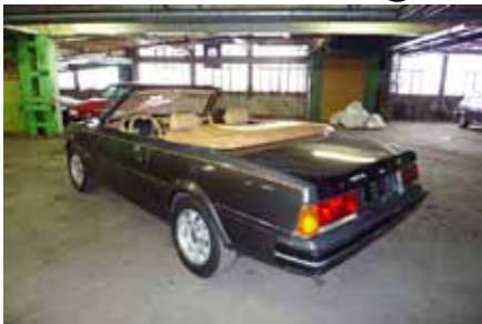
Prototype de la Peugeot 505 cabriolet