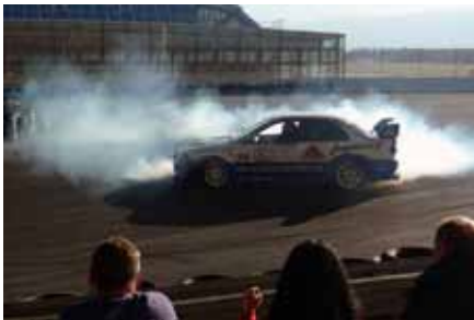
Moins facile avec une 4 roues motrices qu'une deux roues