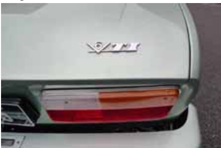
Dernière version avec le V6 à injection de 144 chevaux