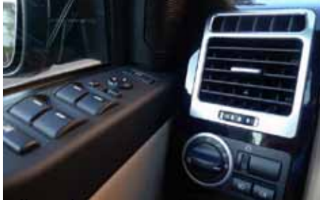
Il y a des commandes un peu partout y compris à gauche du volant