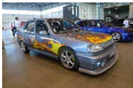
Venu du Var, ancien modèle de Peugeot. Le Style est ancien