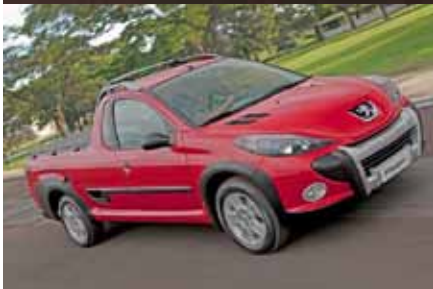
Peugeot 207 au goût d'aventurier des grands espaces brésiliens

Développé au Brésil, le pickup a été conçu pour répondre aux besoins de la clientèle locale. Basé sur la 207 brésilienne et le Partner, le Hoggar se décline en plusieurs versions. Sa charge utile est de 742 kg pour la version X-Line,