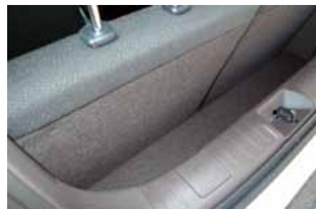
La capacité passe de 32 à 292 litres. Mouchoir et tongues