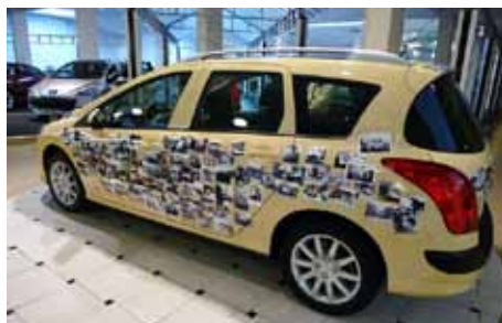
La 50'000'000ème Peugeot