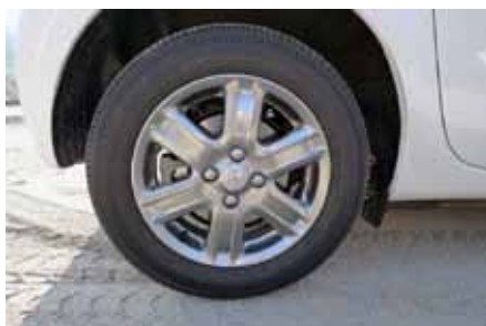
Jantes alu en 15 pouces avec pneus en 175/65 R 15