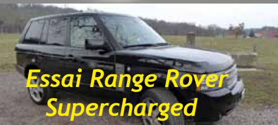
Essai Range Rover Supercharged