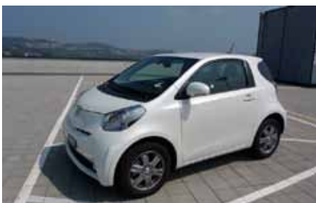
Grand pare-brise, gros yeux qui vous regardent et nez ultra-court