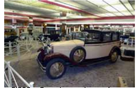
3'000 m2 sont ouverts en plus au Musée de l'Aventure Peugeot