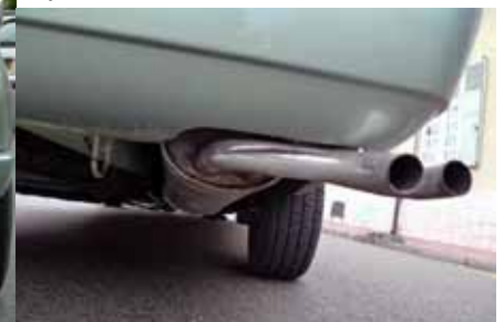
La double sortie d'échappement "Spaghettis" caractéristique Peugeot