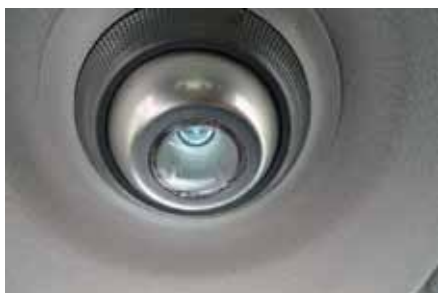
L'éclairage intérieur est stylisé par une lampe des plus design