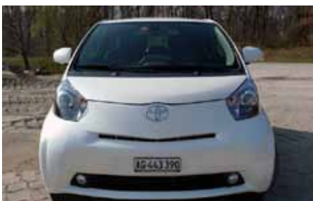
De couleur noire, elle peut se prendre pour le casque de Dark Vador