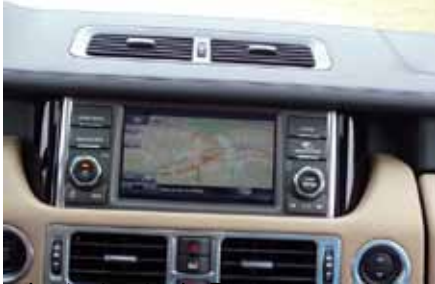
La technologie Dual View est bluffante