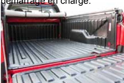
Bac de benne dans le plus pur style pickup

Le moteur 1.4 FlexFuel de 1360 cm 3 développe une puissance maximale de 82 chevaux (alcool) et de 80 chevaux (essence) à 5250 tr/mn pour un couple 129 Nm à 3250 tr/mn. Il est associé à une boîte de vitesses manuelle à cinq rapports. Les rapports 1 et 2 sont réduits pour améliorer le démarrage en charge.