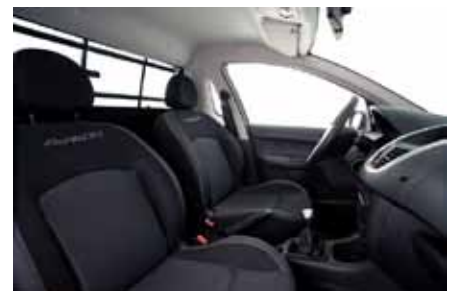
L'intérieur correspond à celui de la berline 207

Le 1.6 L FlexFuel de 1587 cm 3 développe une puissance maximale de 113 chevaux (alcool) et de 110 chevaux (essence) à 5600 tr/mn pour un couple 155 Nm à 4000 tr/mn.