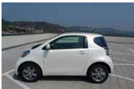
Une ligne futuriste pour une citadine bourrée de charme