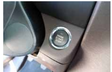
Pas de clef, un bouton Start / Stop