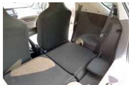
Position des sièges lorsque vous faites vos achats du weekend