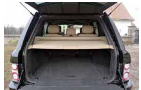
De 535 à 2099 litres. L'accès reste difficile vers la banquette arrière