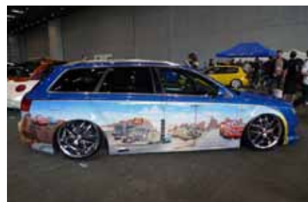
A votre Droite, les héros de Cars