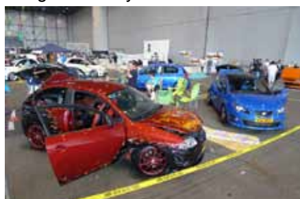
Vue des modèles du Club Tuning 4 Honor