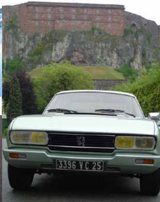
La Peugeot 504 Coupé pose devant le Lion de Belfort