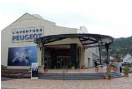
Entrée principale du Musée de l'Aventure Peugeot à Sochaux

Peugeot A 200 ans, et le Lion, son emblème date de 1858