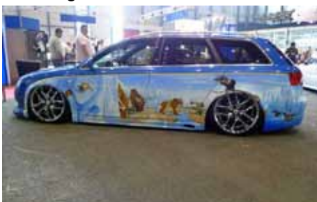
A votre gauche, les héros de l'Age de Glace