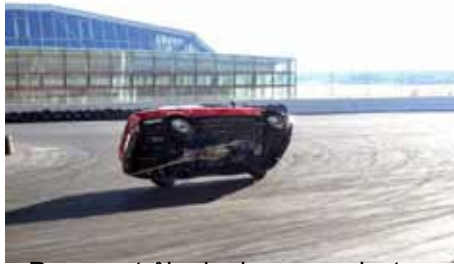
Pour contrôler le dessous, c'est efficace mais pas pratique