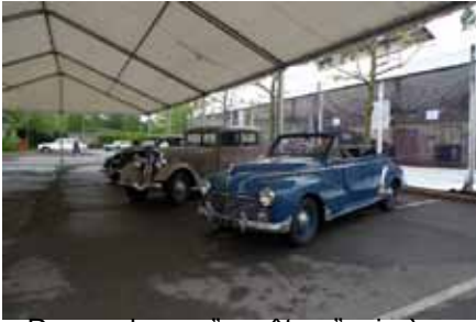
De nombreux "ancêtres" mis à disposition pour un essai routier