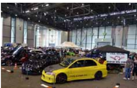
Vue du stand Club Tuning Road on Fire