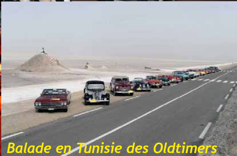
Balade en Tunisie des Oldtimers