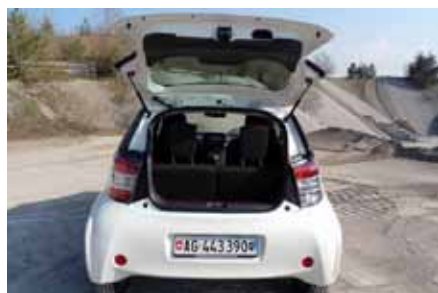
Le hayon s'ouvre très largement sur un coffre de 32 litres