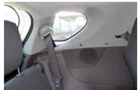
Puit de lumière pour les places arrière