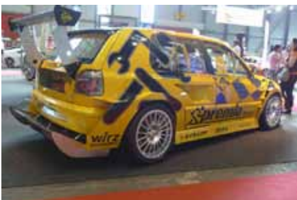
Parmi les exposants, plusieurs professionnels dont Premio Pneus

Né au Etats-Unis et au Japon, le « Tuning » est arrivé en Europe via l'Allemagne. Petite anecdote, le terme « Tuning » a été francisé