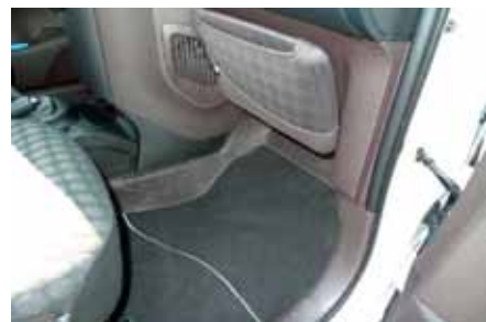
La boîte à gants est amovible. Originalité de l'iQ