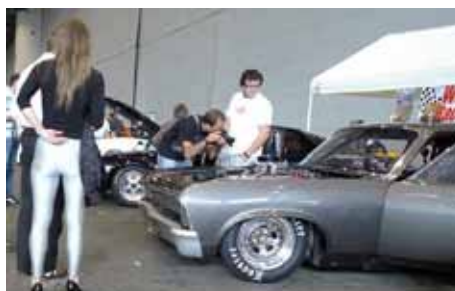
Tous les beaux châssis n'ont pas forcément quatre roues