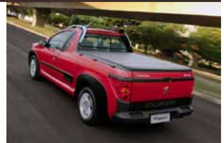
La version Escapade est la plus fun des versions

Développé au Brésil, le pickup a été conçu pour répondre aux besoins de la clientèle locale. Basé sur la 207 brésilienne et le Partner, le Hoggar se décline en plusieurs versions. Sa charge utile est de 742 kg pour la version X-Line,