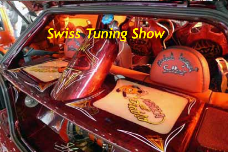
Swiss Tuning Show