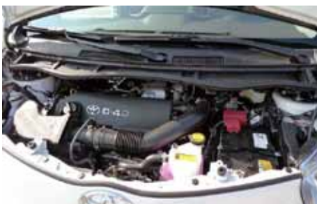
Le moteur de 1.4 L D-4D de 90 chevaux est suffisant mais non sportif