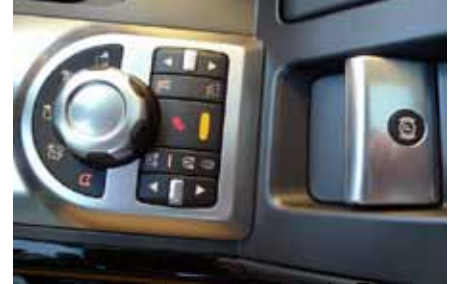
Le rhéostat pour le Terrain Response et le bouton du frein à main