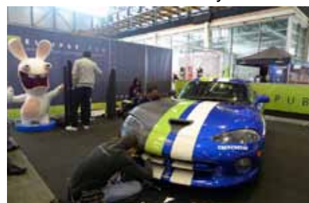
Transformation d'une Viper en imitation carbone