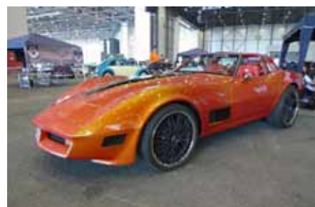
Très belle réalisation. Sobre pour cette Corvette Haut Savoyarde