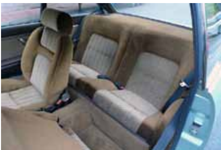
Le coupé 504 est un 2 + 2. Les sièges arrière sont confortables