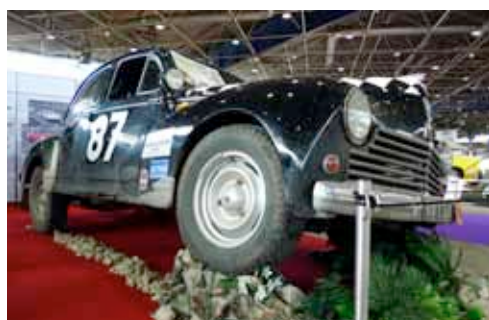
Peugeot 203 Pékin Paris de Pierre-Yves Maisonneuve et Jean-Paul Lamy