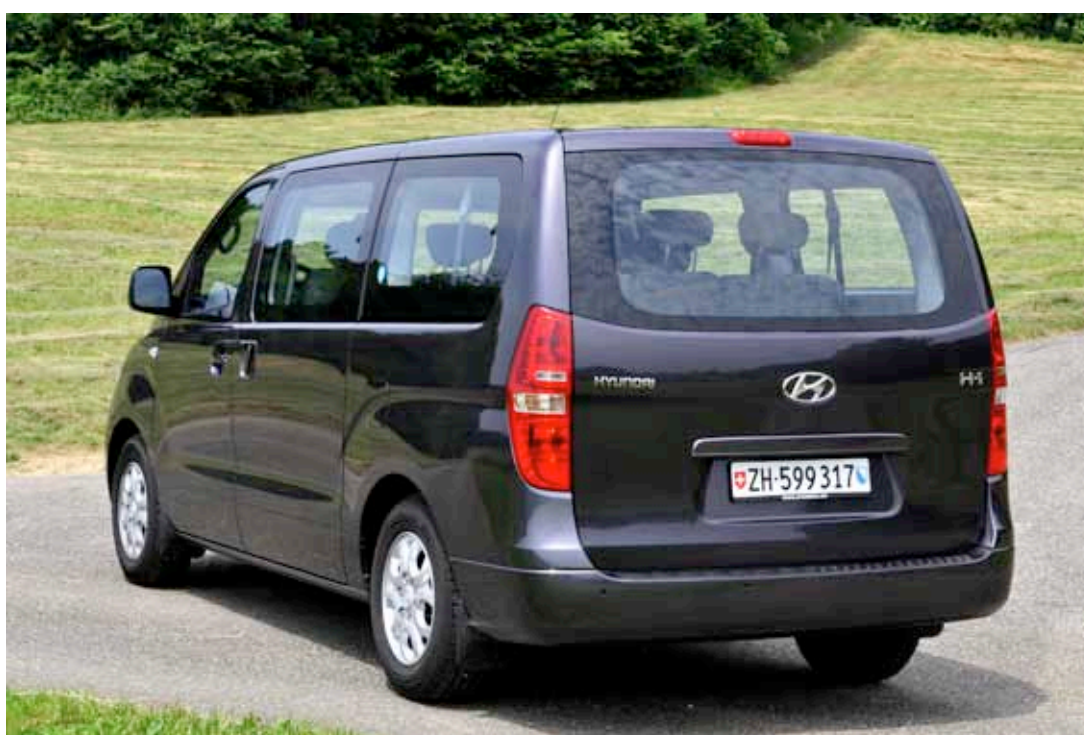
Large hayon arrière, surface vitrée importante, ligne musculeuse

L' ensemble fait sérieux et solide. Les ajustements sont dans la bonne moyenne. L'ambiance à bord est excellente et l'espace disponible est impressionnant. Il n'est pas un seul passager qui ait de quoi se sentir floué. Même les grands gabarits seront à leur aise. La rangée centrale coulisse pour accéder aux places du fond. Toutefois, l'espace reste mesuré. Tous les dossiers sont réglables en inclinaison et le coffre (851 L en version 8 places) permet encore d'accueillir les valises.