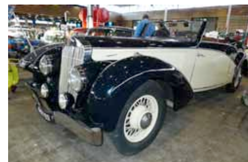
Delage Type D6-70 cabriolet de 1936