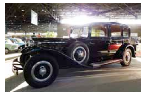
Lancia Dilambda «Castagna» 1932, livrée neuve à Lugano. V8 de 3960 cm 3 et 100 chevaux