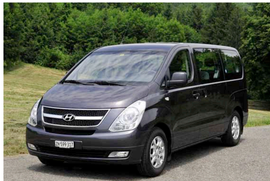
Le Hyundai H1 People fait oublier l'insipide version précédente - Starex - avec son avant un tantinet agressif, très carré. Un brin d'esthétisme pour un véhicule typé utilitaire

G rand et fort. Ainsi peut se résumer le H1 People. Ce qui frappe au premier regard, c'est son look. Face carrée et agressive, une esthétique bien proportionnée. Ses optiques avant sont travaillées juste ce qu'il