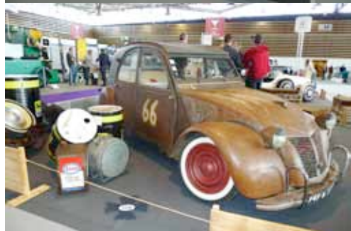
La Guigulette, Chez MI Jo, le rendez-vous des Collectionneurs