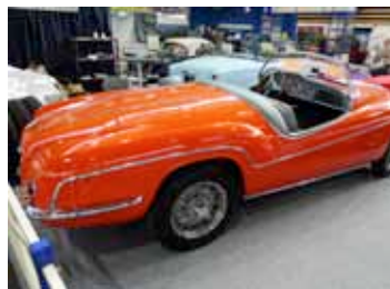
Alfa Romeo Ghia Aigle

torique. Autre véhicule rare, une DS 21 Prestige dont la particularité vient de son toit ouvrant pour les places arrière.