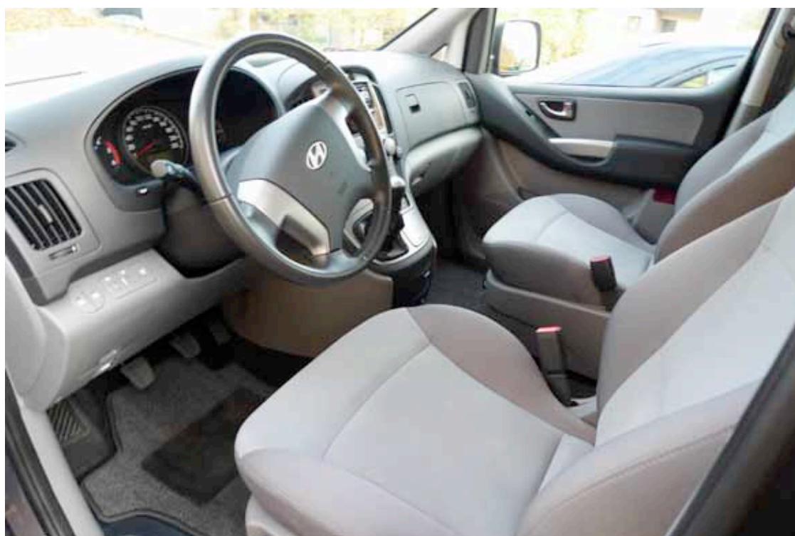
Intérieur soignée, confort à toutes les rangées, qualité honorable des plastiques

Un vrai moteur à disposition avec une cylindrée de 2.5 L développant 170 chevaux pour un couple de 392 Nm dès 2'000 tr/mn associé à une boîte à 5 rapports. Chaud devant ! En ville, les 5 mètres et quelque de l'animal demandent une petite adaptation. Nous avons apprécié la discrétion du moteur tout comme les courses raisonnables de l'embrayage et de la commande de boîte.