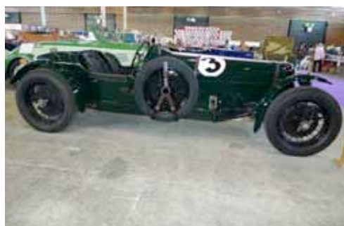
Alvis 3.0 L 1936, 6 cylindres, 3 carburateurs, boîte de vitesse manuelle