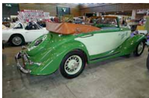
Simca Fiat cabriolet de 1936