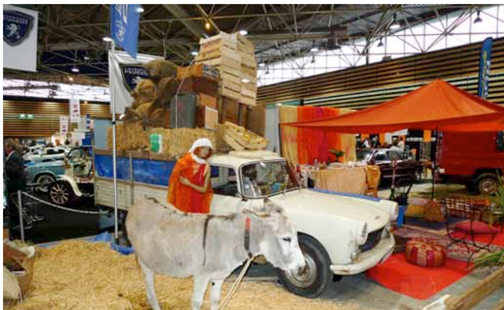
Parmi les personnalités présentes, Paillette a fait forte impression sur le public