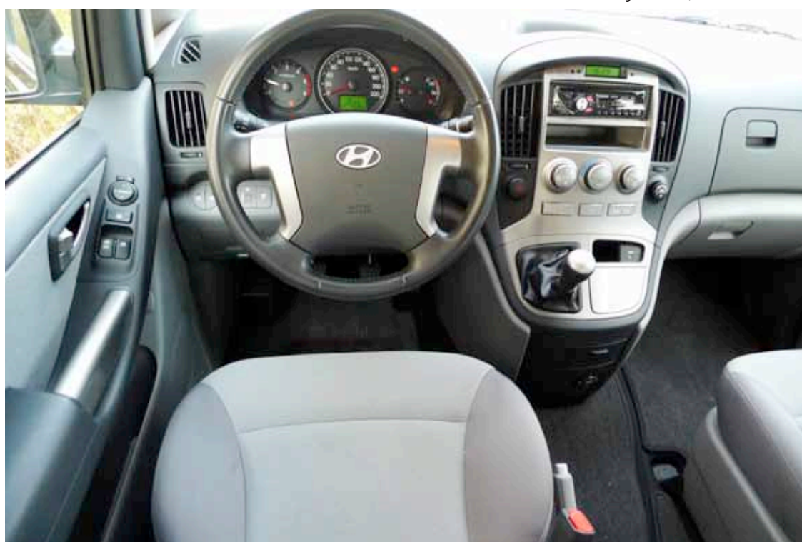
Tableau de bord bicolore et placage aluminium sur le volant et la console centrale

En conclusion, le Hyundai H1 People est bien dessiné. Il est redoutable par sa motorisation de 170 chevaux, un peu gourmand si vous avez le pied lourd, impérial en tenue de route et confort. Le rapport qualité / prix / prestations risque de faire des envieux. Toutefois, il mériterait, comme sur le Starex, une transmission 4x4 pour lui ouvrir de nouvelles destinations. De même, les deuxième et troisième rangées devraient être démontables facilement, voire interchangeables, pour le transformer en bureau roulant. D'accord, au prix canon de CHF 39'990.-. Nous devons être raisonnables.