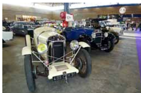
Plusieurs Amilcar, en dehors du stand du club, étaient exposées