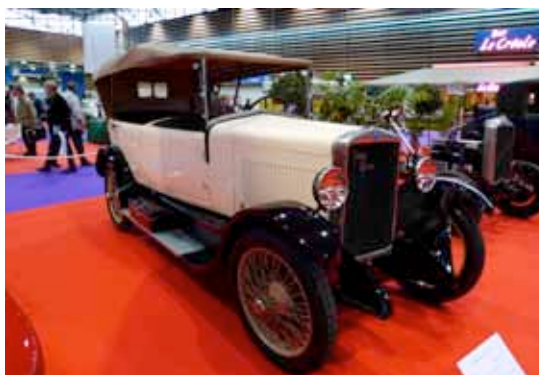
Jean Gras Type A 1925, moteur C.I.M.E. 4 cylindres (Musée Henri Malartre)