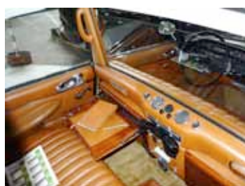
Citroën DS 21 Prestige