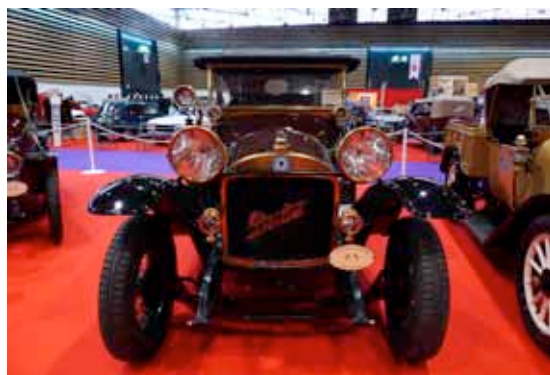
Berliet Type AI 9 Torpédo 1911 (Fondation Berliet)