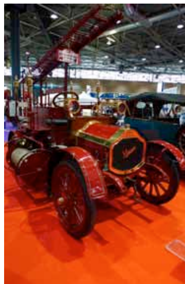
Mieusset 1914 Autopompe type Villeurbanne, pompe à piston 60m 3 /h (Musée des Sapeurs pompiers Lyon Rhône)

Trois collections (Fondation Berliet, Musée Henri Malartre et Musée des Sapeurs pompiers Lyon Rhône) ont exposés de nombreux véhicules datant des années 1900 à 1930.