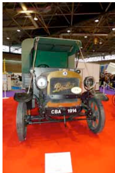
Berliet CBA 1913 - Véhicule de la Voie Sacrée (Fondation Berliet)