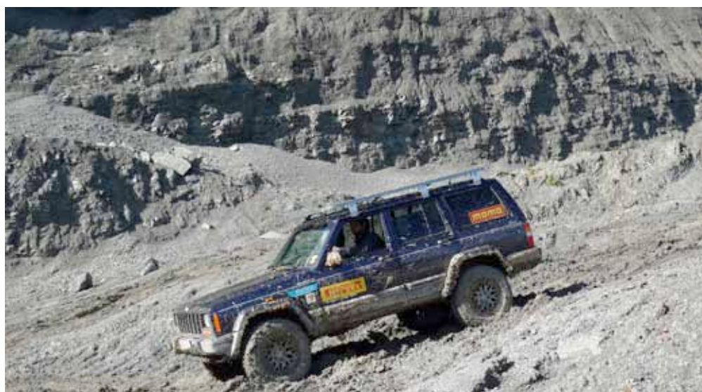
Paysage lunaire dans lequel évolue ce Cherokee 4.0 L, en dessous Discovery surfant sur la boue