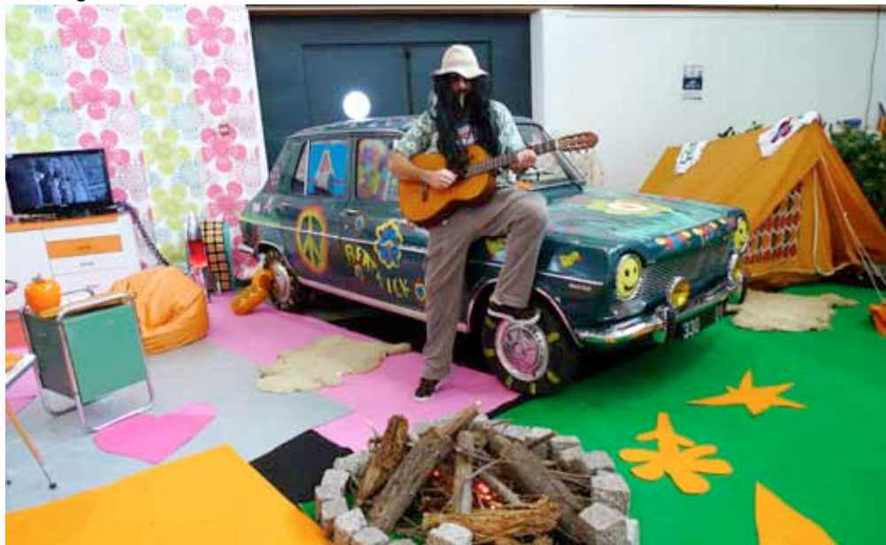
Les années Baba Cool sur le stand Simca avec une 1100 soixante huitarde