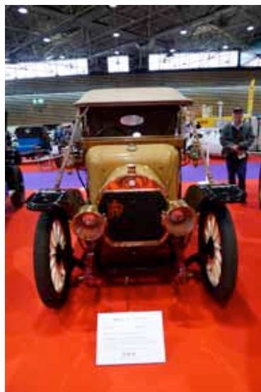
Pilaïn 1912, camionnette plateau ridelle, fabriquée de 1901 à 1918. Boîte manuelle accolée au pont arrière