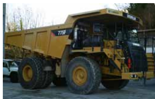
Vu sous cet angle, pas mal pour le tout terrain

permis à tous les participants ou presque de se faire plaisir sans risquer de démolir leur véhicule. Sauf le pilote du Discovery, qui, trop téméraire sans doute, a fini par déboîter le pont avant de sa machine. Si les couleurs de véhicules étaient variées lors de leur arrivée, le terrain a mis tout le monde d'accord sur la tendance actuelle: brun ocre par boue fraîche, brun jaune par boue sèche. Etant dans une exploitation professionnelle, les systèmes de jet sous pression ont permis à chaque participant de repartir avec un véhicule.