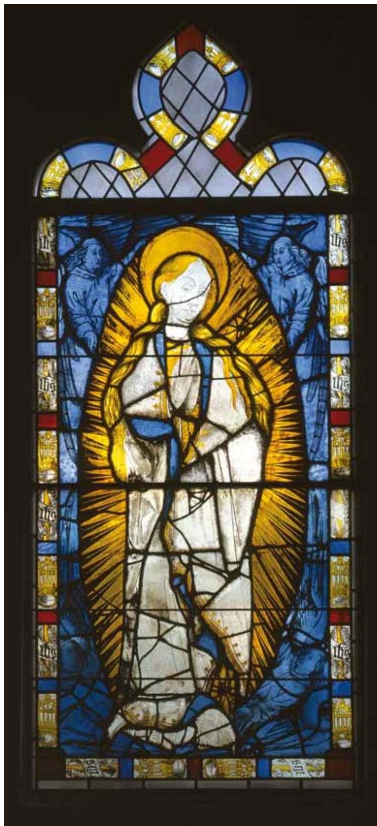
Vierge en gloire, Atelier d'Agnus Drapeir, vers 1455

Actuellement, exposition Brian Clarke jusqu'à fin avril 2011